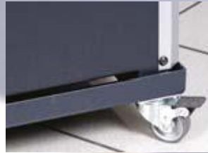
Транспортна рама /допълнителен аксесоар/