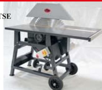
Рол-циркуляр със защита при рязане