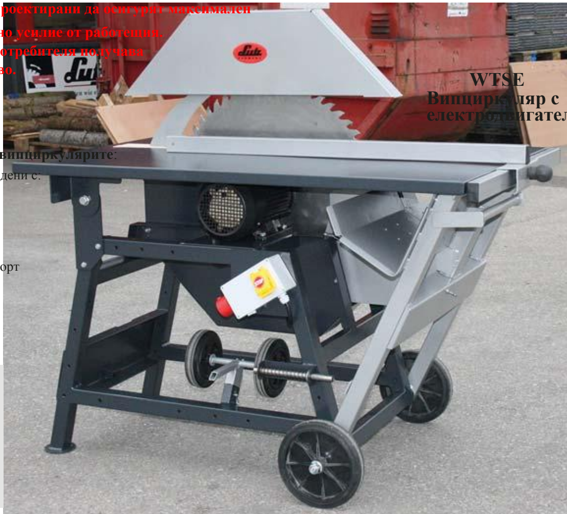
WTSE Випциркуляр с електродвигател

Lutz-машините са проектирани да осигурят максимален ефект при минимално усилие от работещия. С нашите машини потребителя получава максимално удобство.