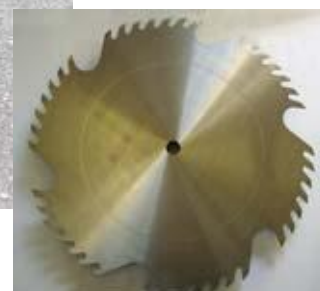
Цирк. диск Канибал

Можете да изберете разположението на машината спрямо трактора – 90° или 30°.