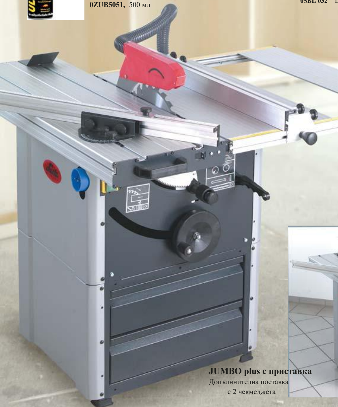
JUMBO plus с приставка