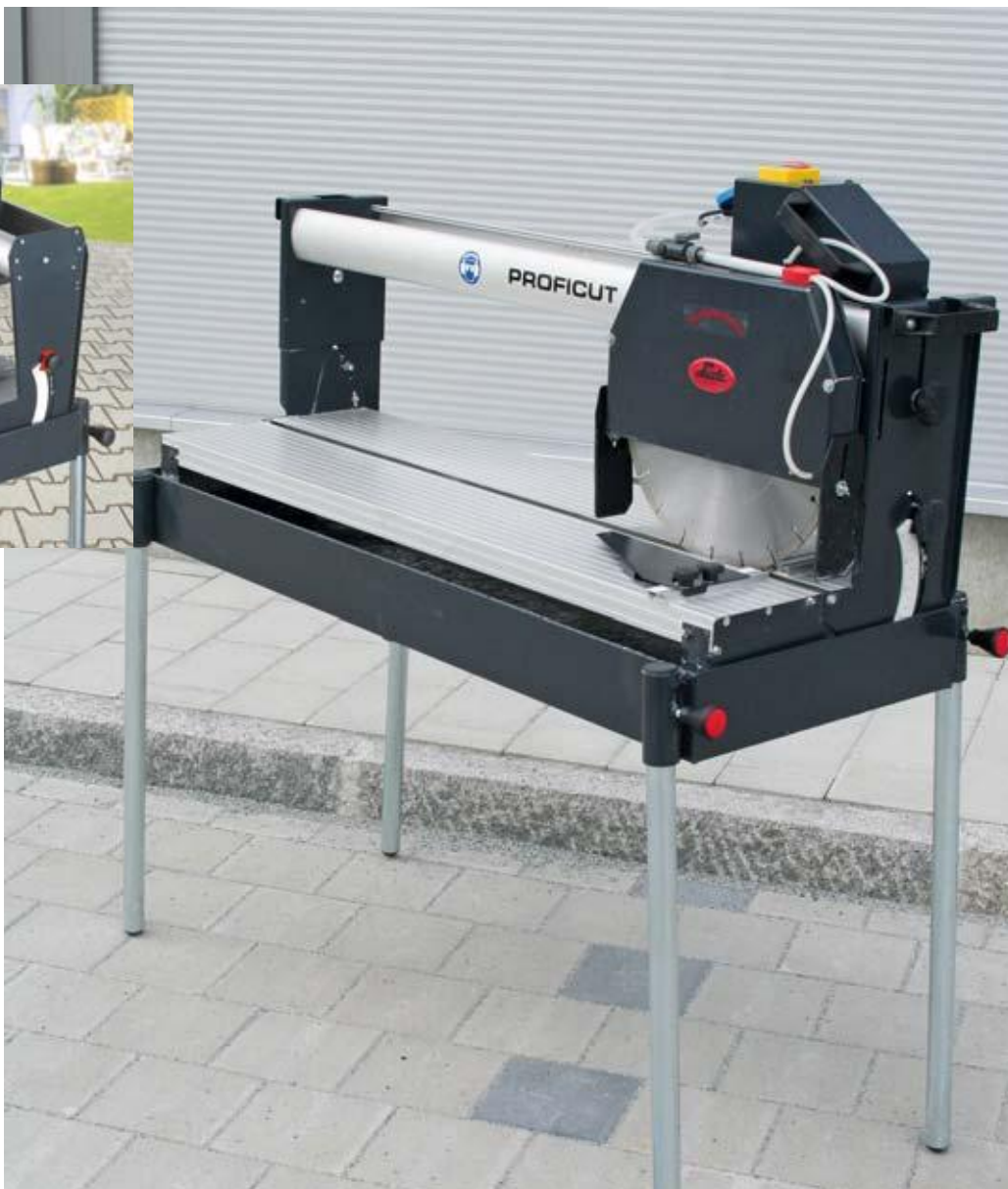
STM840-90-150 Стандартно изпълнение с Регулиране на височината(60мм)