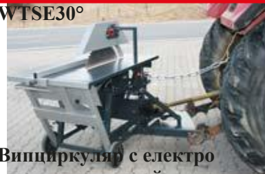
Випциркуляр с електро двигател и устройство за задвижване чрез силоотводен вал на 30°