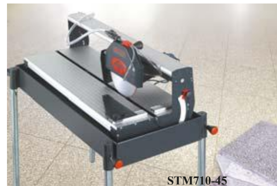
STM710-45 Стандартно изпълнение