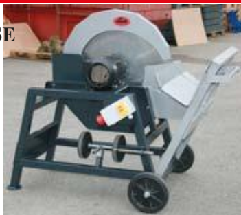
Випциркуляр с ел. мотор