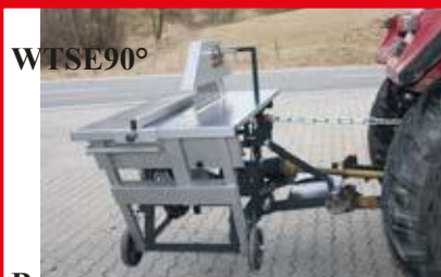
Випциркуляр с електро двигател и у-во за задвижване чрез силоотводен вал на 90°