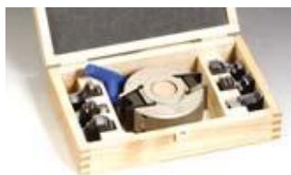
Универсална фрезова глава Ф95мм без фрезер · ф120 с нож