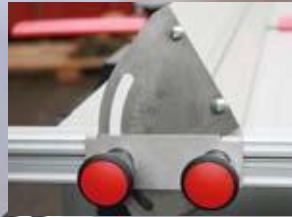
Ъглов линейал със скала /допълнителен аксесоар/