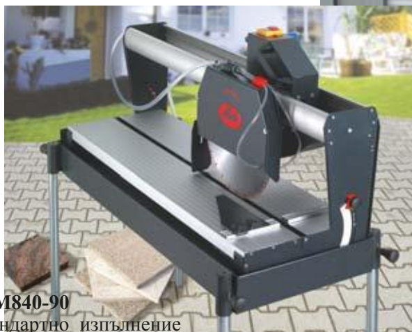
STM840-90 Стандартно изпълнение

0PFC 900A Доп. маса 1140 x 180мм 0SBL 130 Диам. диск 350 x 30 мм гладък 0SBL 131 Диам. диск 350 x 30 мм сегментиран 3PFC 018 Заден калник на диска