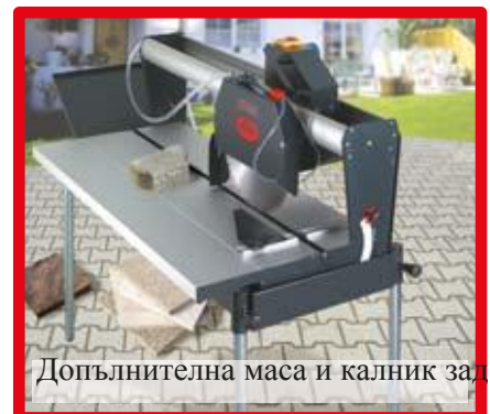
Допълнителна маса и калник зад диска