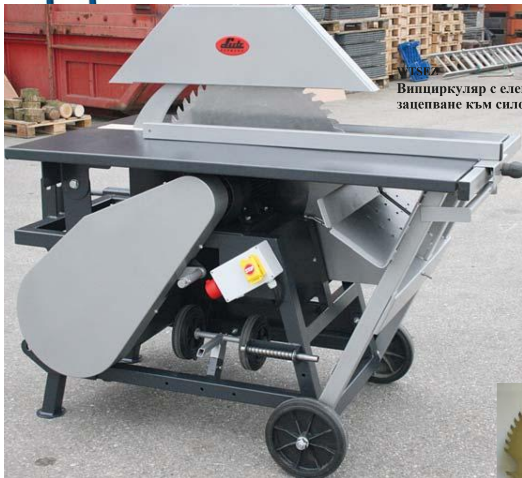
WTSEZ Випциркуляр с електромотор и зацепване към силоотводен вал.

Можете да изберете разположението на машината спрямо трактора – 90° или 30°.