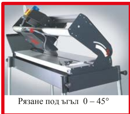
Рязане под ъгъл 0 – 45°