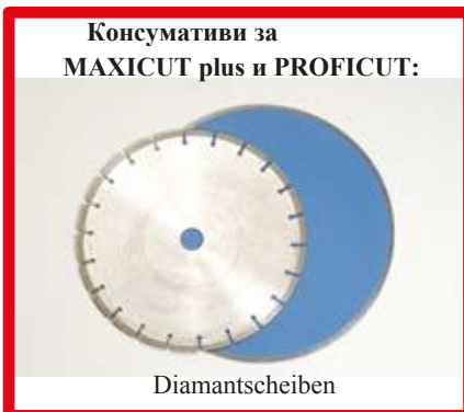
Консумативи за MAXICUT plus и PROFICUT: